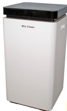
販売継続製品 BS-02 型