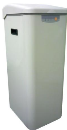
販売終了製品 BS-01 型

電話:0294-38-1212（受付時間:月～金曜日 8:15～12:00/12:40～17:00 ※土・日・祝日を除く）